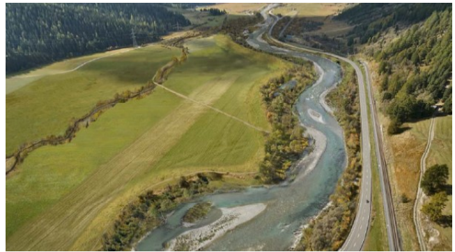
Visualizzazione della zona del progetto, con vista verso Bever come traguardo di sviluppo immaginabile, dopo la messa in atto delle norme di rivitalizzazione (P. Rey, Hydra AG).