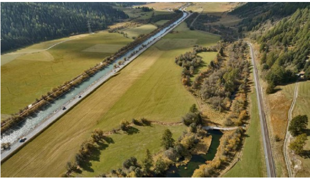
Situazione attuale: sguardo generale sulla zona del progetto, con vista verso Bever

ecologico e paesaggistico, si ambisce anche a raggiungere un grande aumento dell'attrattività per la popolazione ed il turismo.