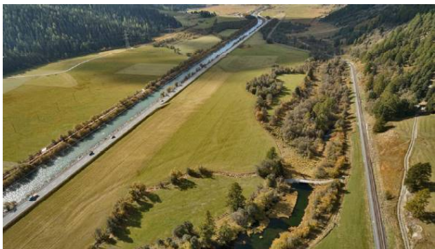
Ist Zustand; Überblick über das Projektgebiet mit Blick Richtung Bever