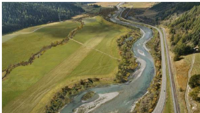
Visualisierung des Projektgebiets mit Blick Richtung Bever als vorstellbares Entwicklungsziel nach Ausführung der Revitalisierungsmassnahmen (P. Rey, Hydra AG).